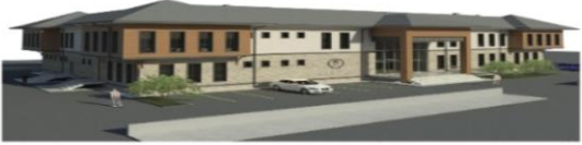
gençlik merkezi 250-6